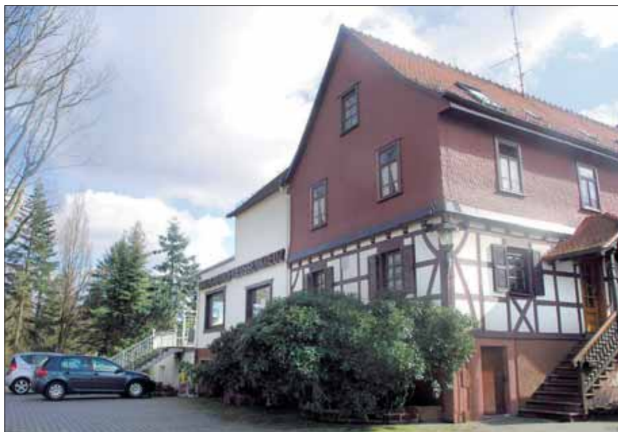
Der Waldgasthof „Reußenkreuz“ an der Krähberg-Passstraße präsentiert sich als schmuckes Odenwaldhaus mit Fachwerk- und Holzschindelfassade.

In wüdziger Höhenluft, mitten im Wald gelegen, ist das Odenwald-3-Sterne-Hotel Gasthof „Reußenkreuz“ idealer Ausgangspunkt für Wanderer, Ausflügler, Frischluft- und Odenwaldfans. Für Bildungsbeflissene sind einige kulturelle Höhepunkte vom Krähberg aus leicht zu erreichen, wie das Deutsche Elfenbeinmuseum und das Schloss in Erbach, das spätgotische Fachwerk-Rathaus und das Spielzeugmuseum in Michelstadt, die 820 erbaute Einhardbasilika in Steinbach, die barocke Abteikirche mit der berühmten Stummorgel in Amorbach, das Freilandmuseum Gattersdorf, der Englische Garten mit dem Wildpark