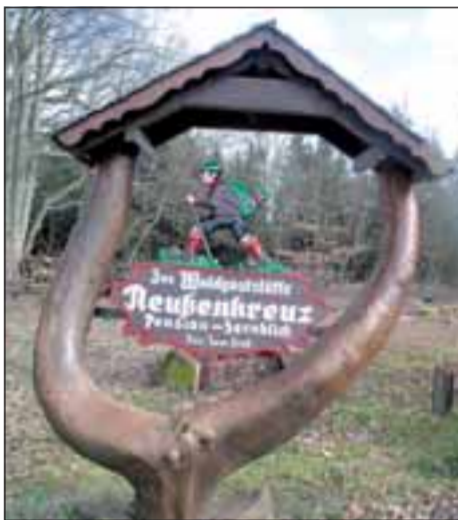
Ein uraltes Schild weist dem Wanderer den Weg zum Gasthof „Reußenkreuz“.

Gewürzte Filetstücke beidseitig in Butter braten, auf vorgeheizter Platte anrichten. Bratenfett abgießen, Bratenfett mit Wein und Orangensaft ablöschen, mit Wildfond auffüllen und mit Cayennepfeffer würzen. Leicht einkochen lassen, dann die Medaillons mit der Sauce überziehen. Die leicht erwärmten Orangenschnitze auf dem Fleisch verteilen. Dazu passen Spätzle, Kroketten, Schupfnudeln und frische Pfefferlinge.